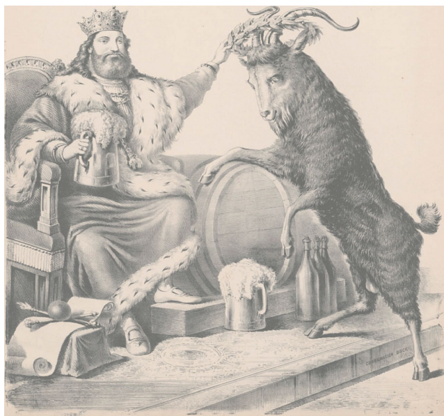
Gravure uit de Smithsonian Library New York

Uiteindelijk komen we dan terecht bij het restaurant "Park van Cambrinus" aan de kerk in Blaasveld.