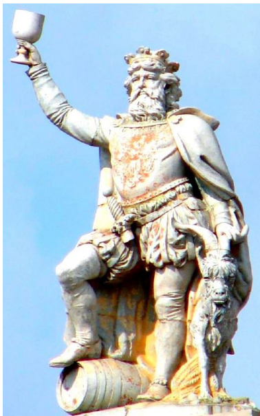
Beeld van Cambrinus bovenop de Falstaff Brewery in New Orleans USA